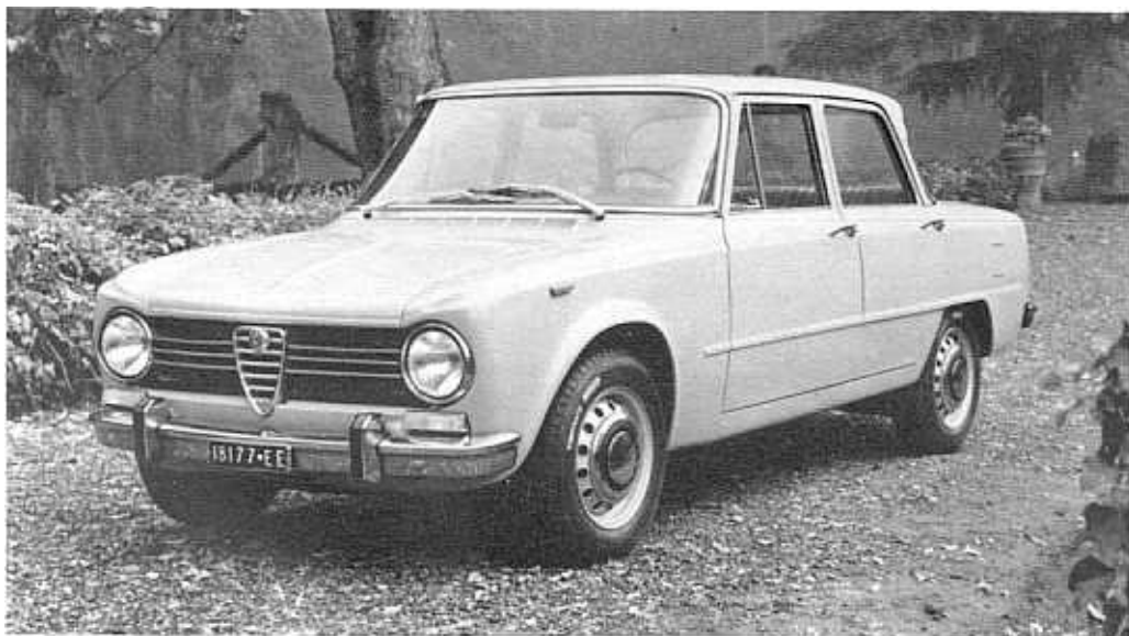
La Giulia 1300 Super versione 1970.

Nell'aprile del 1972 sono state introdotte le seguenti migliorie: nuovo volante guida a tre razze, quattro proiettori circolari (2 da 170 mm e 2 da 136 mm), prese d'aria sul frontale di nuova forma, nuovi gruppi ottici posteriori, lavaparabrezza a pedale, coprizzo ruote, mascherina anteriore con cinque profili cromati, nuove scritte posteriori, nuovi sedili, quadro di nuovo disegno. Con queste migliorie la 1300 Super differisce dalla Giulia 1600 Super solo nella cilindrata.