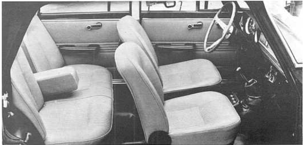
Abitacolo Giulia 1300 Super versione 1972.