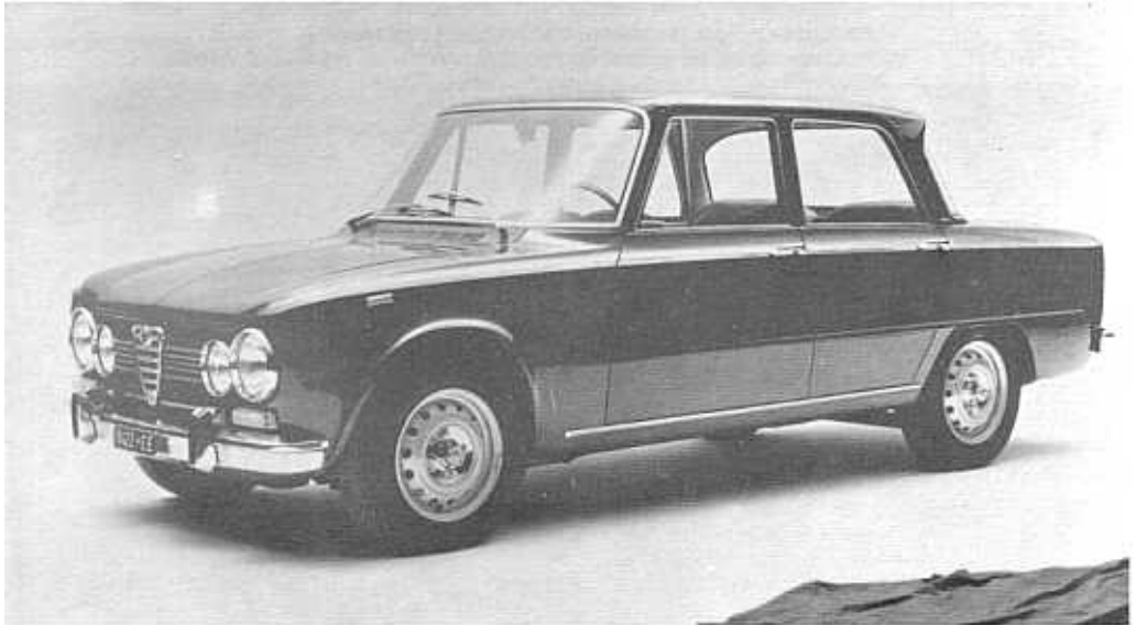
La Giulia 1300 Super versione 1972.

In April 1972 the following improvements were introduced: new three-spoke steering-wheel, four circular headlights (2 of 170 mm and 2 of 136 mm), a new form of front air intake, new rear lighting-units, pedal-operated windscreen-washer, hub-caps, front grid with five chromium bars, new rear lettering, new seats, a newly designed dashboard. With these improvements the 1300 Super differs from the Giulia 1600 Super only in the power of its engine.