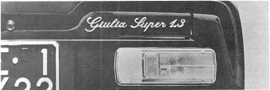
Scritta posteriore sulla Giulia 1300 Super.